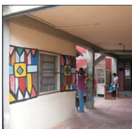
CAPA: Detalhe do painel pintado na sede de MARIA MULHER pelas participantes da Oficina de Arte e Estética Negra

Catálogo na publicação: Bibliotecária Carla Maria Goulart de Moraes CRB 10/1252